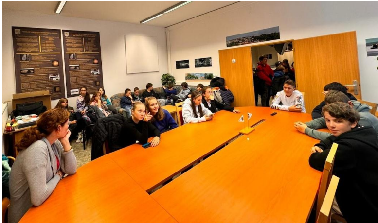
6. a 8. třída v Praze