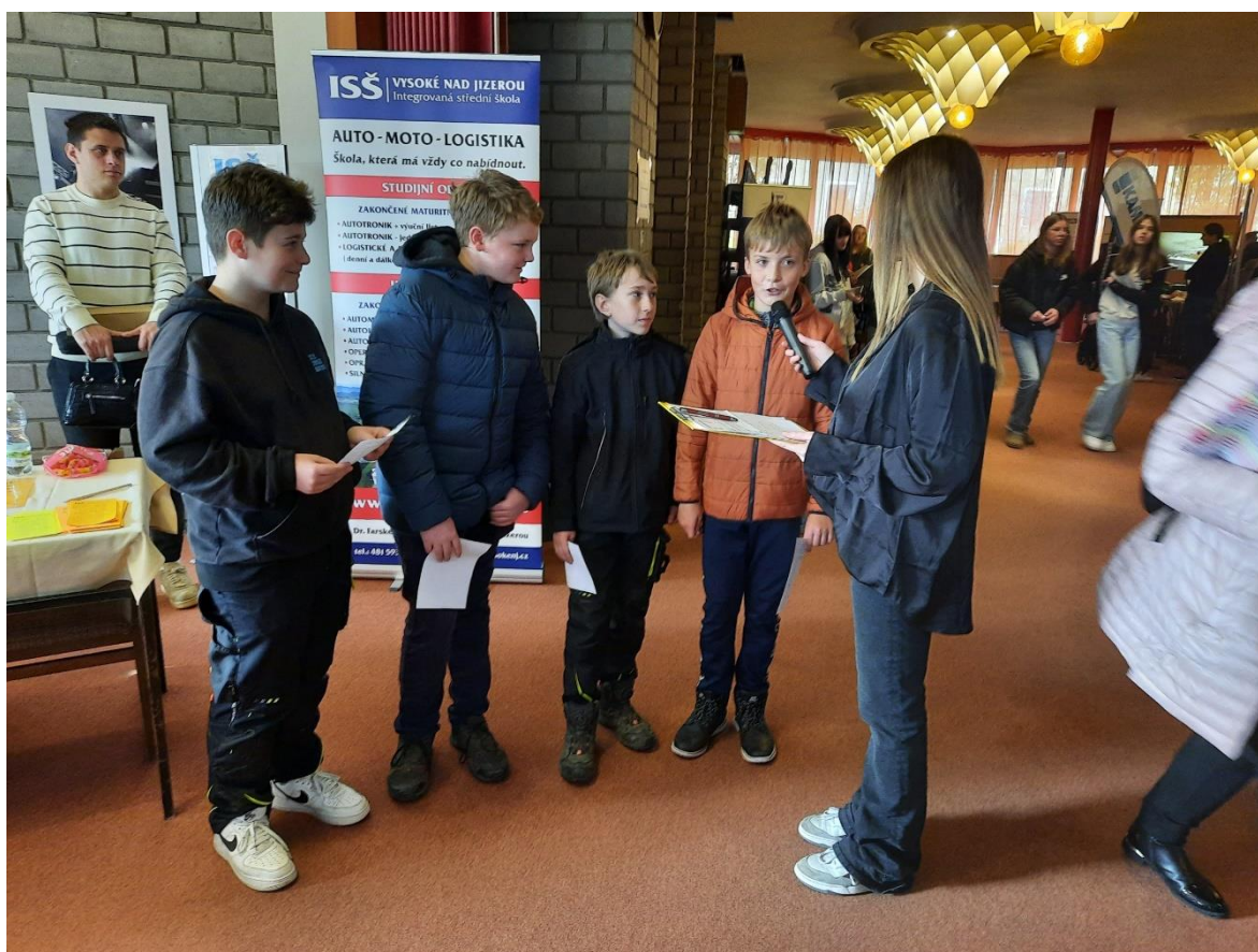
7. třída v rozhovoru

5. 11. se 9. a 7. třída vydala do Semil na burzu škol, která se konala v Kulturním centru. Pro ty, co ještě nevědí, kam dál na školu, to byla vlastně EDUCA v Liberci sice v malém, ale velká možnost se rozhodnout. Na malý prostor tam bylo poměrně dost středních škol, každá měla svoje místo, kde jsme se mohli dozvědět něco nového o škole, která nás zajímala, a případně se na něco zeptat. Každý si mohl vybrat to, co ho zajímalo, případně najít úplně nový obor, o jehož existenci zatím ani nevěděli. Určitě užitečná akce.