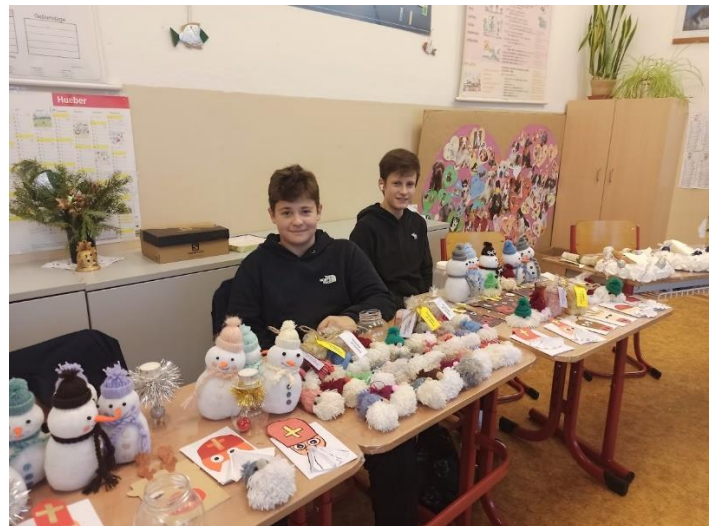
Dělna pro velké