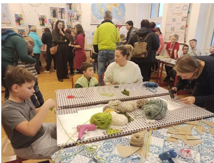
Dělnička pro malé