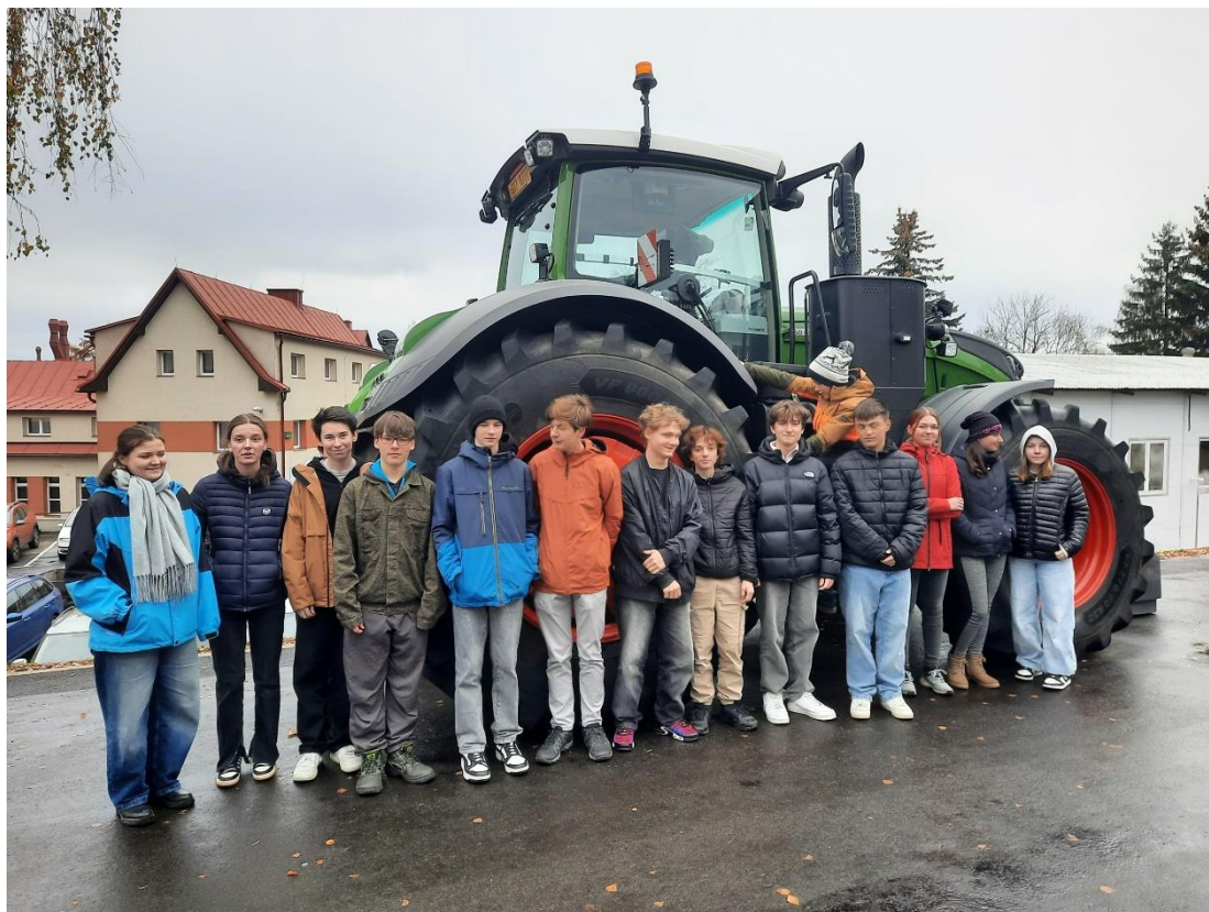
9. třída na IŠS

body, vybrali si odměnu a šli zpět do školy. Celá akce byla jako minulý rok záživná a zajímavá.