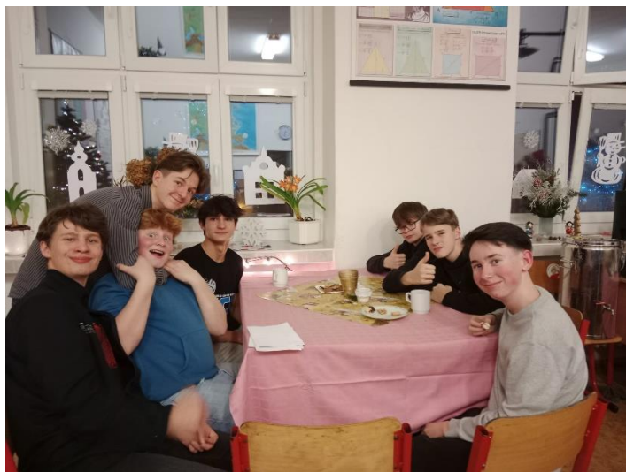
5 žáků 9. třídy, 1 žák 8. třídy a 1 bývalý žák