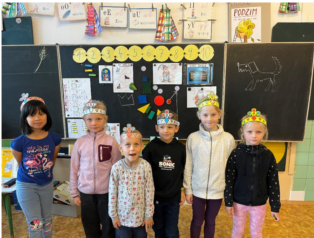
1. třída s korunami