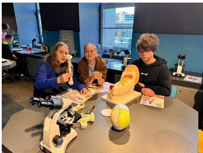
8. třída zkoumá kosti