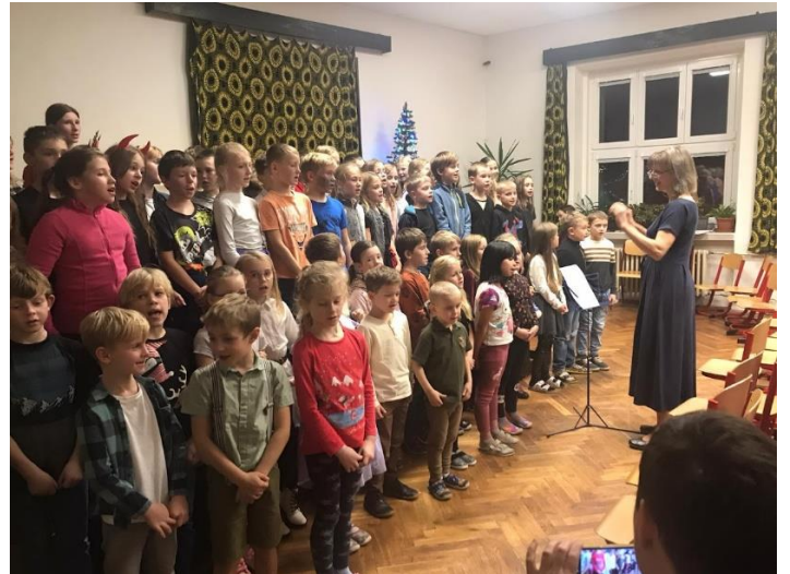
Prozatímní sbor tvořený žáky různých tříd zpívá na jarmarku