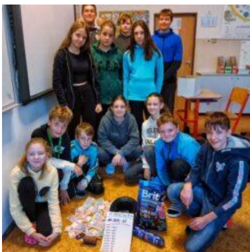
7. třída se sbírkou na úturek