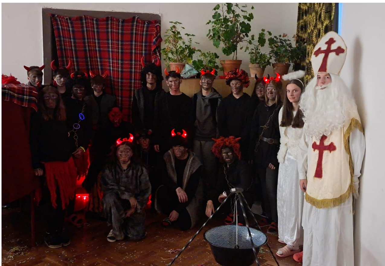
9. třída na Mikuláše