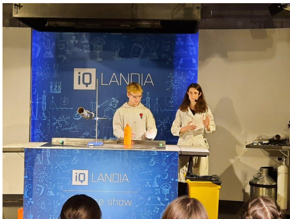
Roman dělá pokusy