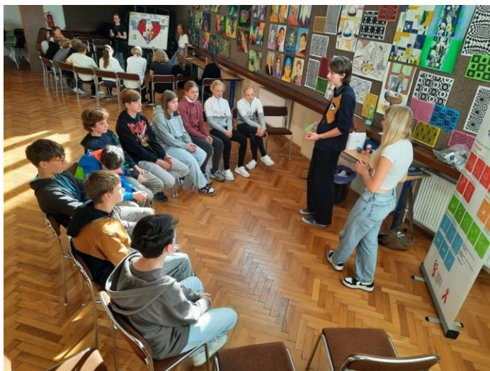
8. a 9. třída v Gymnáziu Ivana Olbrachta v Semilech