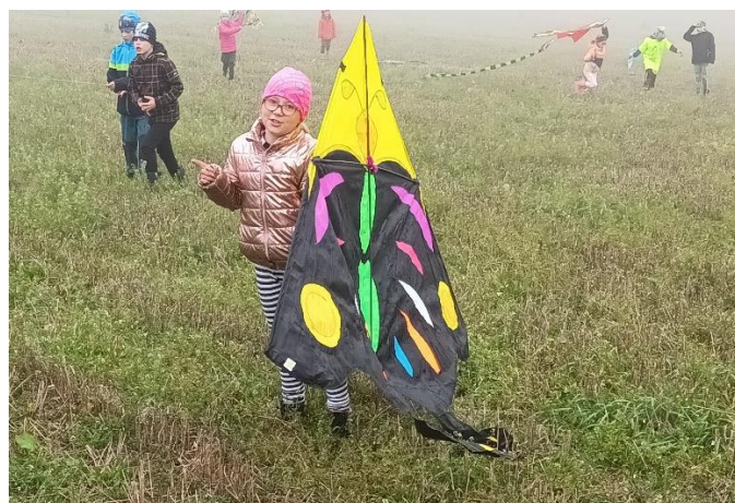
Drakiáda . 1. stupeň