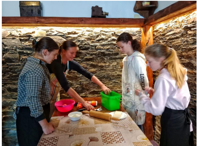
Vaření v Crazy baru – 7. třída